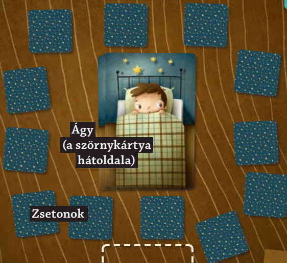
Ágy (a szörnykártya hátdala)